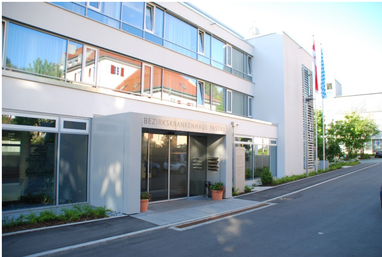
Bild der Einrichtung / Organisationseinheit

Bezirkskrankenhaus Passau Fachklinik für Erwachsenenpsychiatrie, Psychotherapie und Psychosomatik und Tagesklinik sowie einer Psychiatrischen Institutsambulanz.