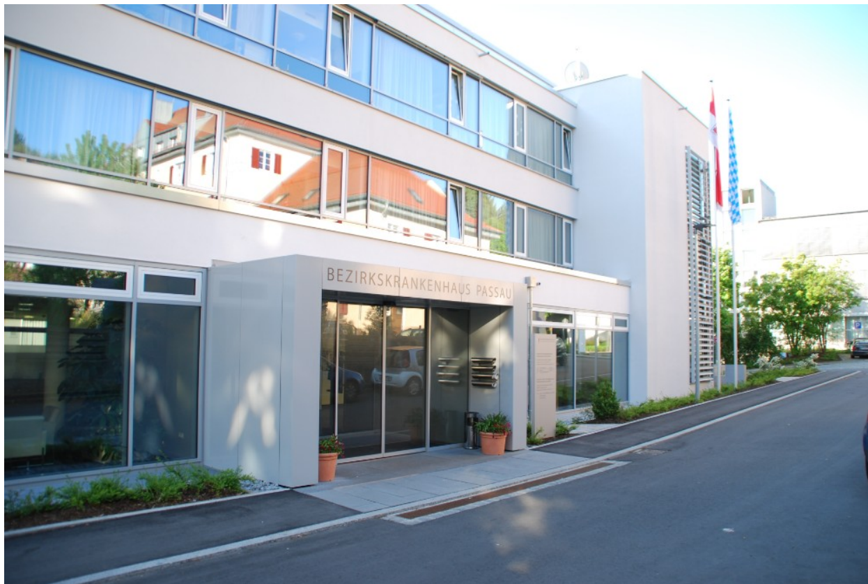
Bild der Einrichtung / Organisationseinheit

Bezirkskrankenhaus Passau Fachklinik für Erwachsenenpsychiatrie, Psychotherapie und Psychosomatik und Tagesklinik sowie einer Psychiatrischen Institutsambulanz.